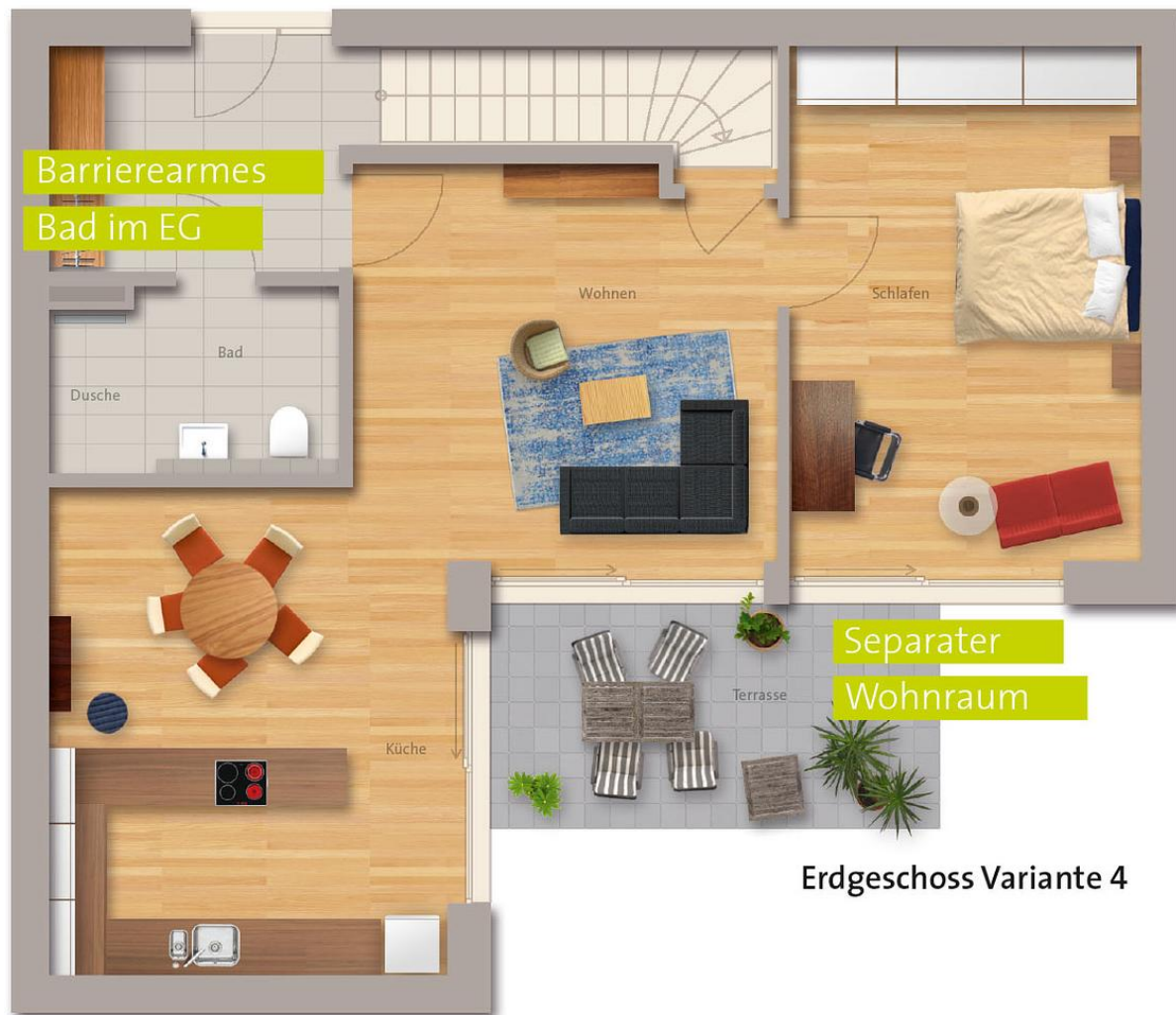
Erdgeschoss Variante 4