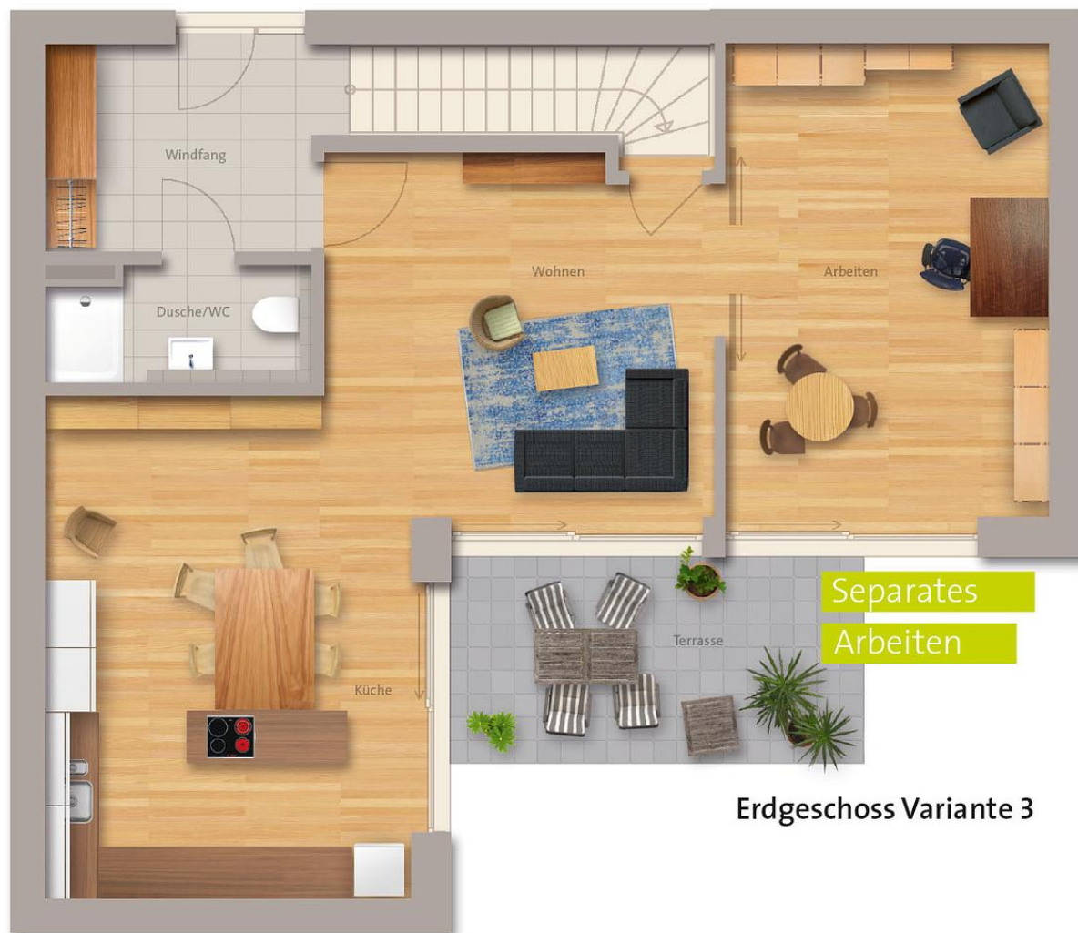
Erdgeschoss Variante 3