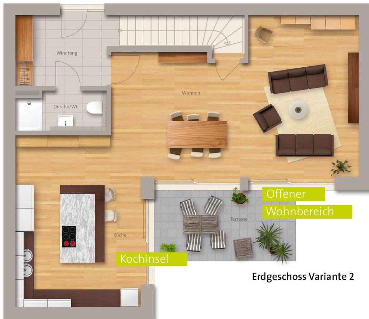
Erdgeschoss Variante 2