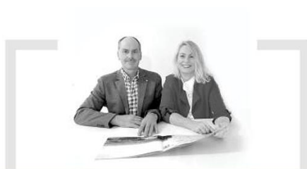
Weidinger Wohnbau, Bauunternehmen, Delning „Sicherheit und kompromisslose Qualität.“