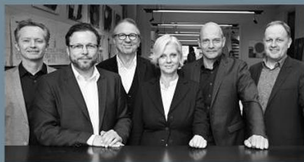
Berschneider + Berschneider, Architekten BDA + Innenarchitekten „Anspruchsvolle Architektur aus einem Guss.“

Wir verwandeln Träume in Bauwerke – durch Planung, Inspiration, Handwerk und Know-how – und sind Ihr zuverlässiger Partner.