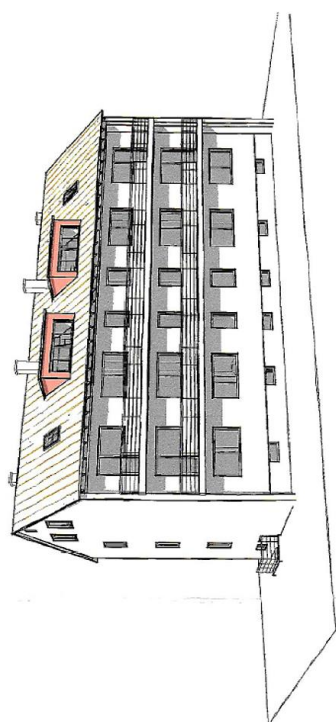
3D-Ansicht von Süden