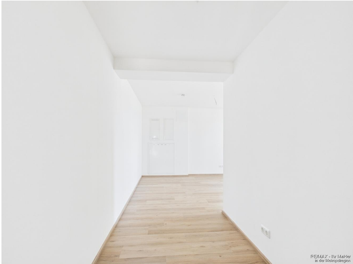
RE/MAX - Ihr Makler in der Metropolregion