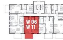
ERDGESCHOSS / 1. OBERGESCHOSS