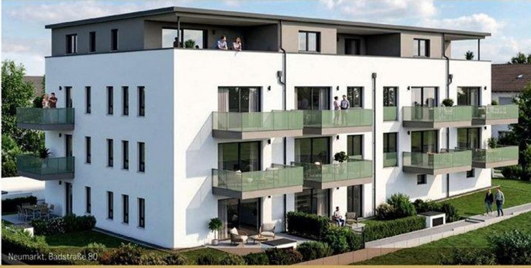
Neumarkt, Badstraße 80