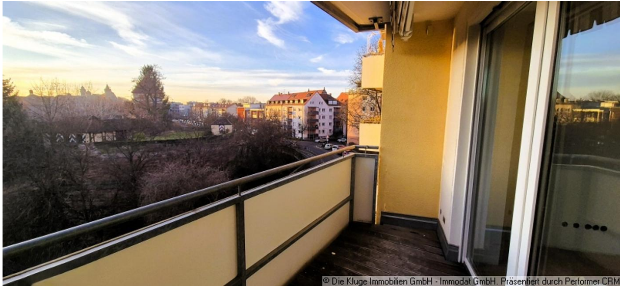
© Die Kluge Immobilien GmbH - Immodat GmbH. Präsentiert durch Performer CRM