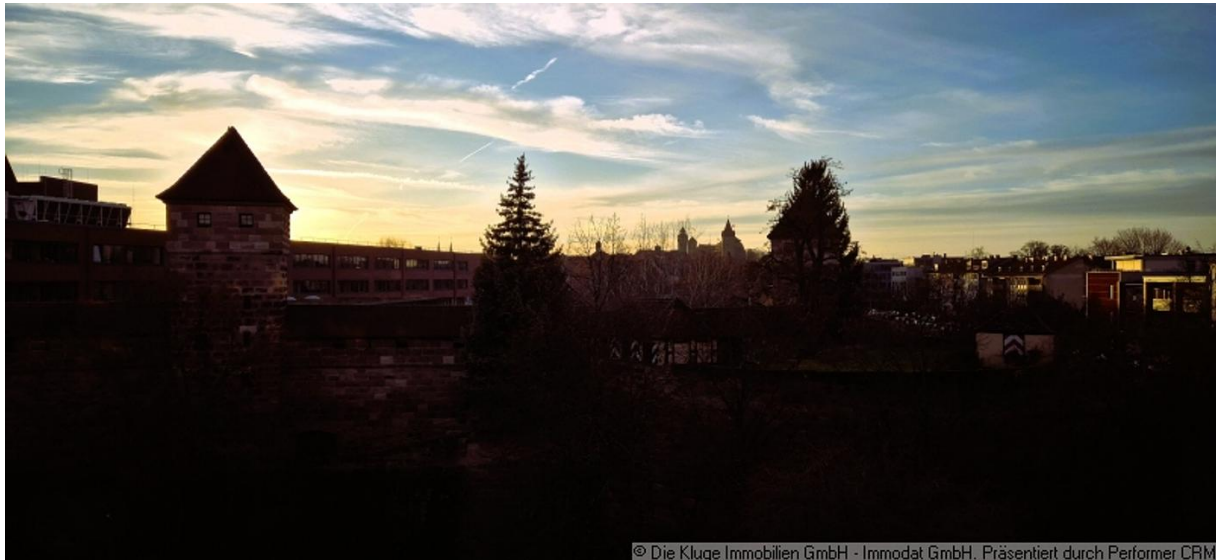
© Die Kluge Immobilien GmbH - Immodat GmbH. Präsentiert durch Performer CRM